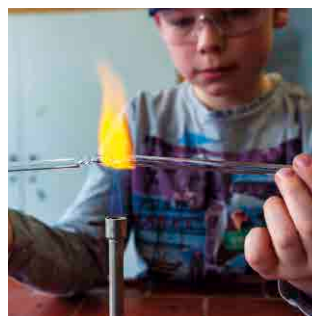
Glasbiegen am Tag der offenen Tür