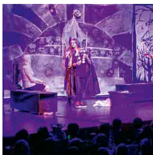
Musical „Dracula“ 2017